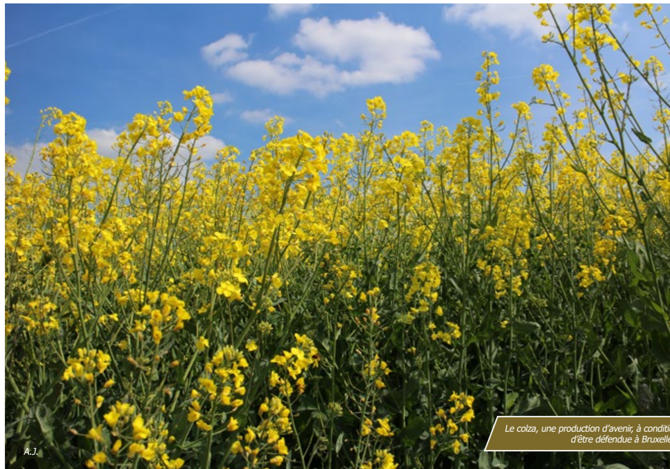
La colza, une production d'avenir, à condition d'être défendue à Bruxelles.

L'avenir de l'agriculture va des circuits courts jusqu'aux marchés mondiaux. L'agriculture française ne peut pas se permettre de s'en passer.